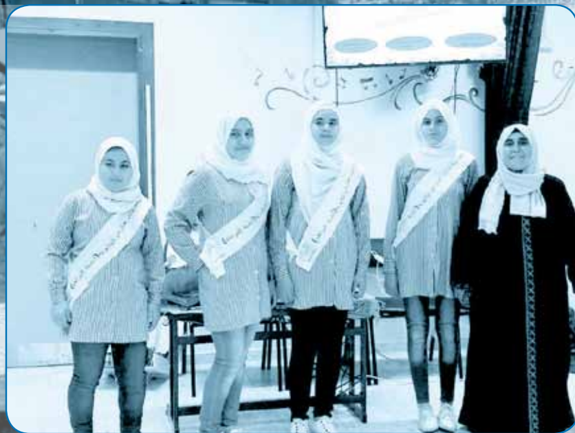
المدرسة: بنات حارس الثانوية