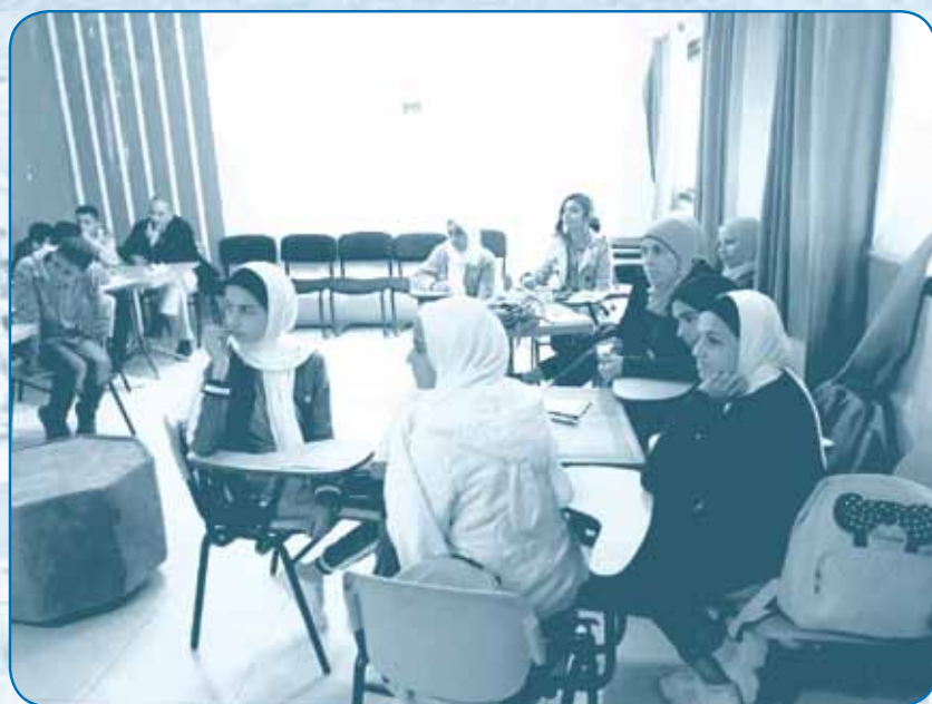
المدرسة اليابانية الأساسية للبنات