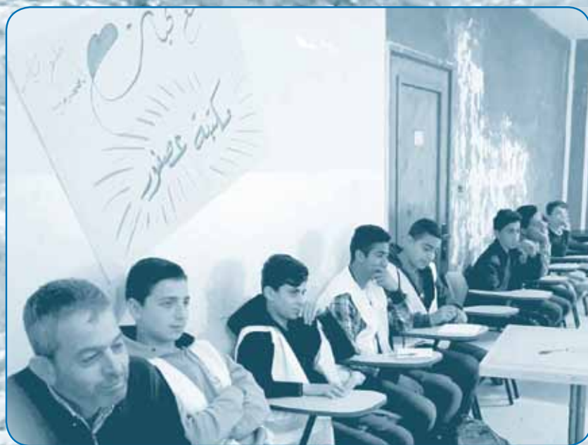
مدرسة ذكور واد الفارعة الأساسية