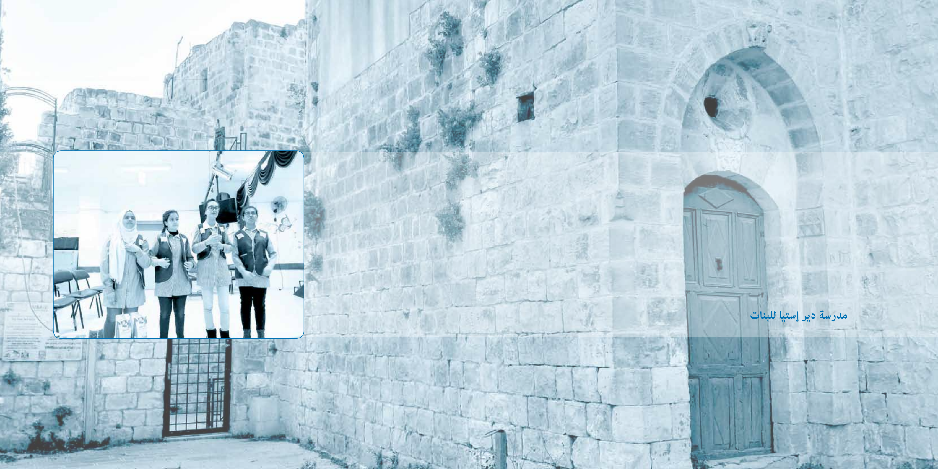
مدرسة دير إستيا للبنات