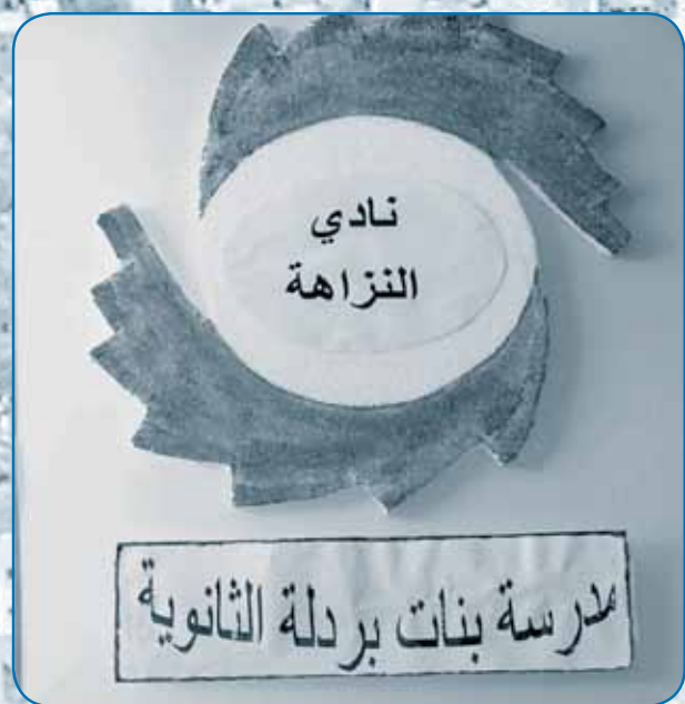
مدرسة بنات بردلة الثانوية