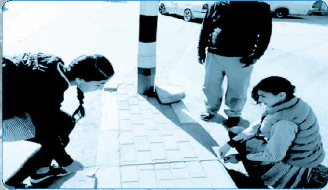
توسيع شارع رأس العروض في بلدة سعي